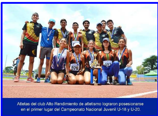
Atletas del club Alto Rendimiento de atletismo lograron posicionarse en el primer lugar del Campeonato Nacional Juvenil U-18 y U-20.

El club Alto Rendimiento hizo honor a su nombre, luego que sus integrantes lograran el primer lugar con un total de 18 medallas de oro, 10 de plata y 2 de bronce en el Campeonato Nacional Juvenil U-18 y U-20 , que se realizó el fin de semana del 12 y 13 de Mayo en la pista del Instituto Nicaragüense de Deportes (IND).