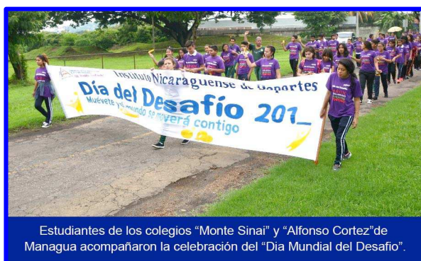
Estudiantes de los colegios "Monte Sinaí" y "Alfonso Cortez" de Managua acompañaron la celebración del "Día Mundial del Desafío".

El día lunes 28 de mayo la Dirección de Educación Física del Instituto Nicaragüense de Deportes (IND), llevo a cabo la celebración del Día Mundial del Desafío bajo el lema "Muévete y el Mundo se Moverá Contigo" con lo cual se realizó una caminata con algunos escuelas de Managua y trabajadores de dicha institución.