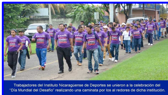
Trabajadores del Instituto Nicaragüense de Deportes se unieron a la celebración del "Día Mundial del Desafío" realizando una caminata por los alrededores de dicha institución.

Dicha iniciativa nació en Saskatoon, Canadá, el invierno de 1983 fue extremadamente frío. Para mejorar la interacción entre las personas y aumentar la temperatura del cuerpo mientras se ejercitaban, el alcalde sugirió que todos saliesen a caminar. Al año siguiente, la ciudad vecina se sumó a la iniciativa, creándose