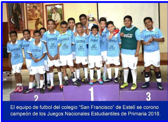
El equipo de fútbol del colegio "San Francisco" de Estelí se corona campeón de los Juegos Nacionales Estudiantiles de Primaria 2018.